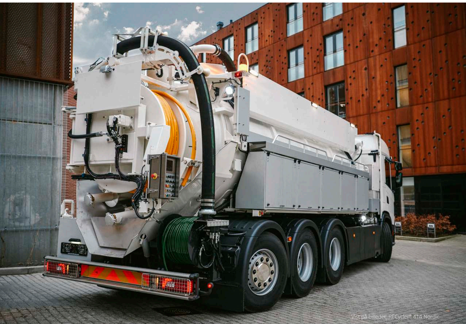
Vist på billedet: RECYCLER® 414 Nordic

Oplev de mange fordele ved et fuldautomatisk genbrugssystem: Øget produktivitet og rentabilitet