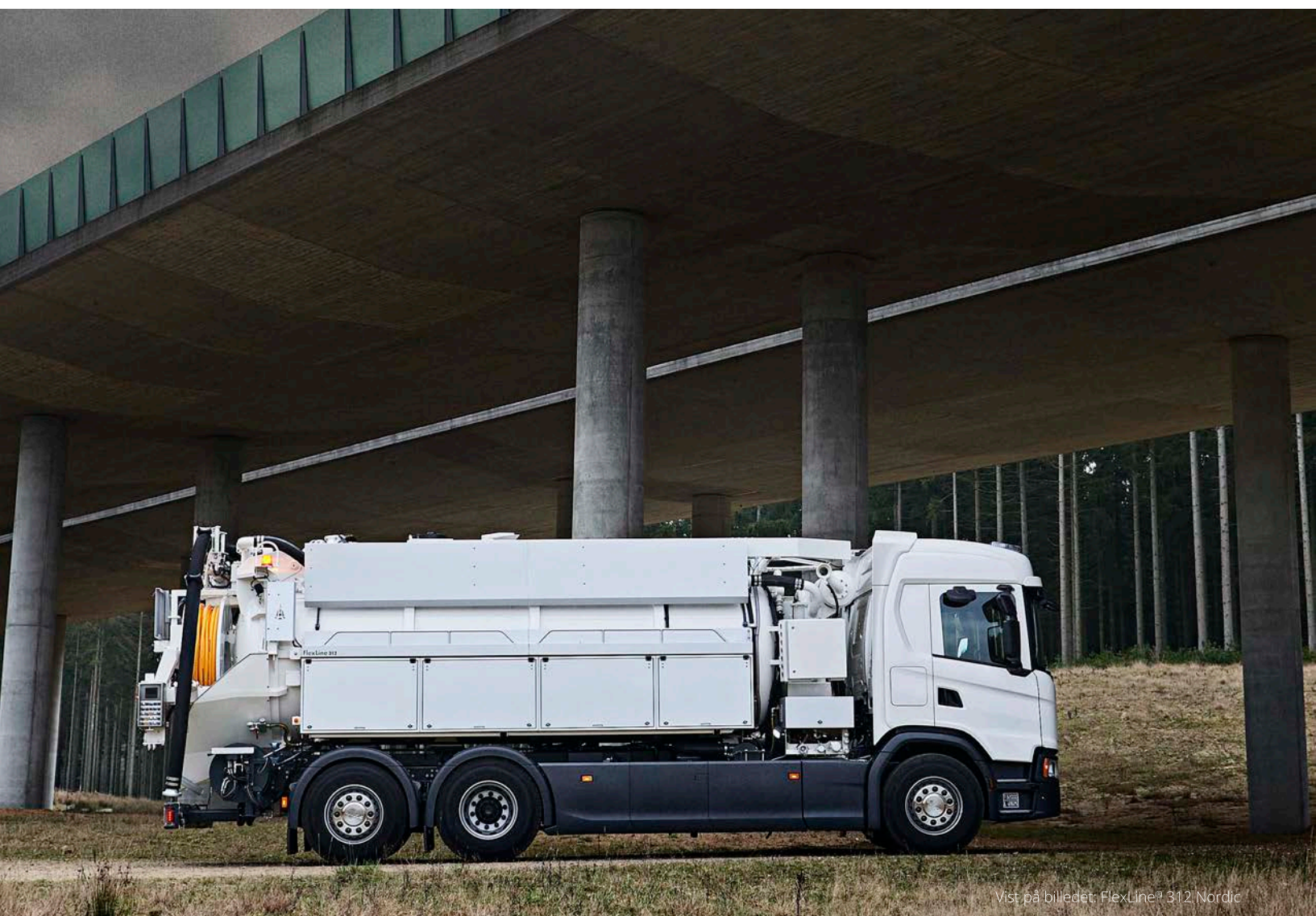
Vist på billedet: FlexLine® 312 Nordio

Et all-round kombianlæg testet af hverdagen og optimeret til at effektivisere tid og brændstofforbrug